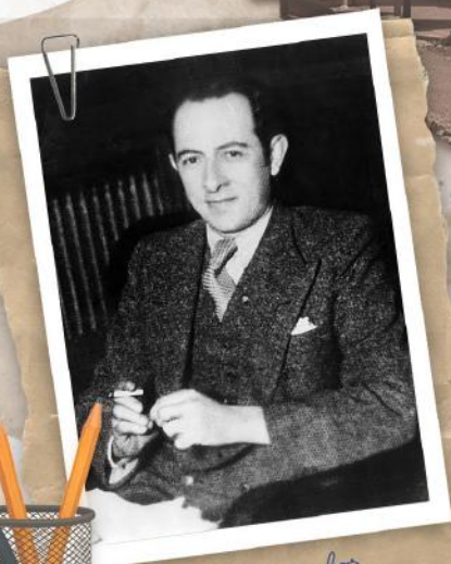
Gobernador Amadeo Sabattini